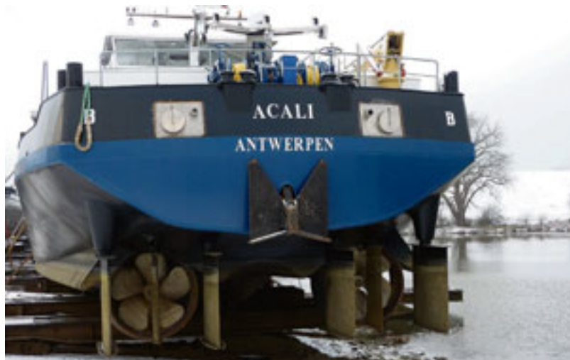
Het achterschip is naar Bruno Somers' eigen ideeën ontworpen. Het is gebouwd met een scherpe tunnel en de schroeven zijn 5 meter uit elkaar geplaatst.

Dinsdag 12 januari vonden de open dag, de feestelijke doop en aansluitend een geanimeerd feest