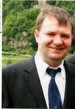
| TIBERIUS KAISER